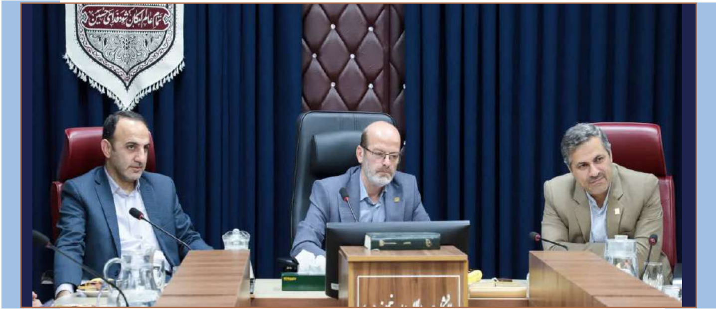
معاون فرهنگی و اجتماعی وزارت علوم :

کلاتری تصریح کرد: تصویر واحد دانشگاهی ایجاد می کند هم افزایی در بین